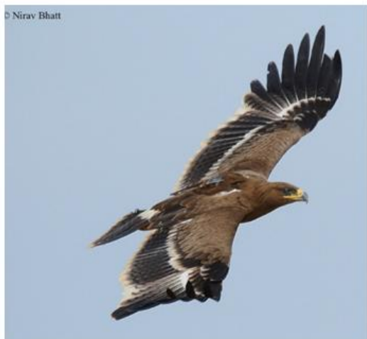
Та самая Мин

Задача исследования – отследить основные пути миграции степных орлов и выявить угрозы для них. Степные орлы занесены в Красную книгу как вымирающий вид. Чаще всего они гибнут от выстрелов браконьеров, ядов (например, тех, которыми травят грызунов) и линий электропередачи. Установив главные пути перелёта и места зимовки, орнитологи стараются снизить эти риски: сделать линии электропередачи в этих районах более безопасными, объяснить жителям, что нельзя травить птиц, и т.д.